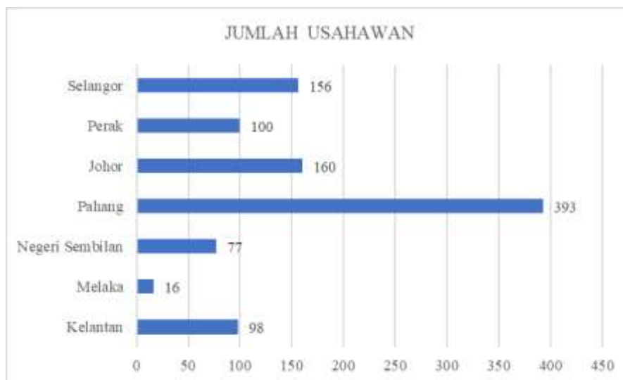
Rajah 2: Jumlah Usahawan Orang Asli mengikut Negeri

Berdasarkan data yang dikeluarkan oleh Jabatan Kemajuan Orang Asli (JAKOA) (2018), jumlah orang asli yang terlibat sebagai usahawan adalah agak tinggi (Rajah 2). Data ini menunjukkan orang asli turut berminat dengan aktiviti keusahawanan. Penglibatan ini memberikan satu petunjuk yang baik terhadap keusahawanan dalam kalangan orang asli. Sekiranya aktiviti ini terus digalakkan, hal ini mampu meningkatkan taraf ekonomi mereka sejajar dengan pembangunan ekonomi sekarang. Pihak berwajib perlu membantu mendigitalkan aktiviti mereka sekali gus mampu meningkatkan lagi jumlah jualan dan perkembangan aktiviti keusahawanan mereka (Mohd Haikal et al., 2020)